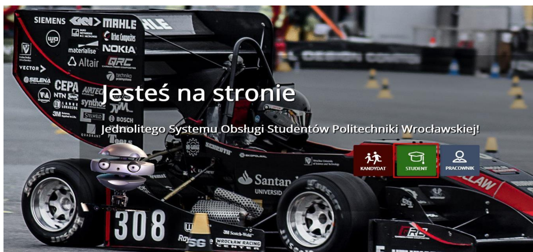
Rys.1. Ekran portalu JSOS

Ślubowanie on-line dla studenta jest udostępnione na portalu JSOS. W celu podpisania ślubowania student/ka loguje się na portal: https://jsos.pwr.edu.pl/ jako „Student”.